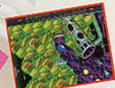
ループトラップに入ると…